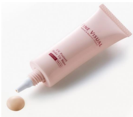
美容成分を贅沢に配合し、 スキンケア感覚で使える化粧下地

カラーは、「オレンジベージュ」1 色展開です。淡く、肌なじみの良い色なので、パーソナルカラーに関係なくお使いいただけます。肌に薄く伸ばすと、自然な血色感を与えるとともに、くすみや色ムラなどの肌悩みをカバーします。