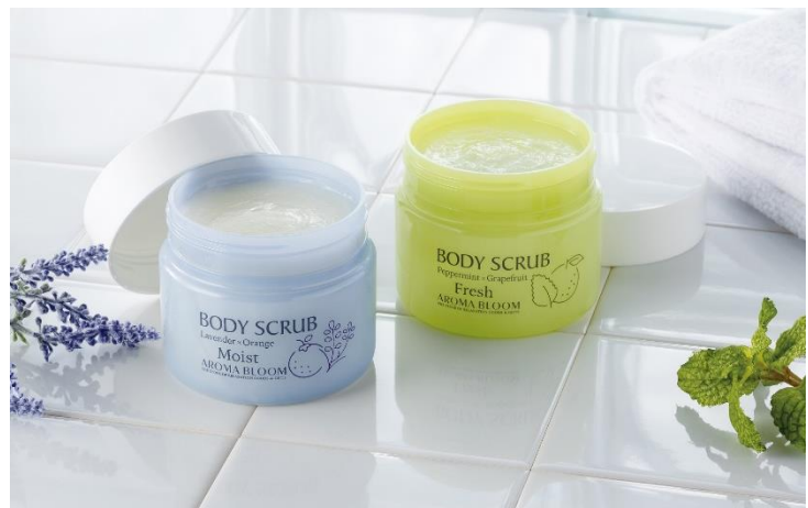
やわらかい肌へと導く「ボディスクラブ モイスト」(左)と トーンアップが叶う「ボディスクラブ フレッシュ」(右)

「ボディスクラブ モイスト」には、なめらかで細かい粒(乳糖)を、「ボディスクラブ フレッシュ」には大きく粗い粒(スクロース)を配合しています。粒の大きさによって肌の仕上がりが変わるので、使用部位や求める肌質によって、それぞれのスクラブを使い分けるのがオススメです。