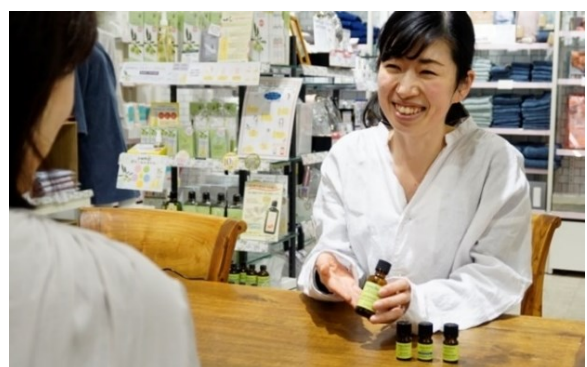
専門資格を持つスタッフがカウンセリング 悩みやシーン別にオススメの香りをアドバイス ※画像はイメージ