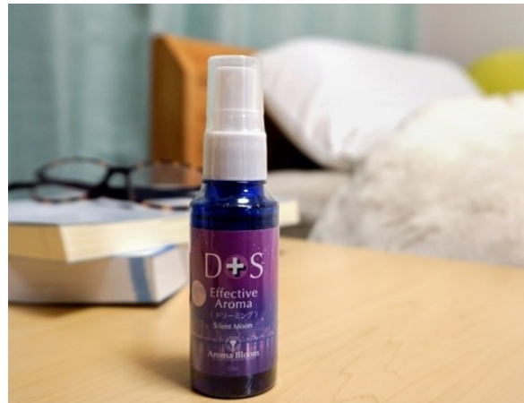
おやすみ前に枕や寝室にシュッとひと拭き 天然精油 4 種をブレンドしたアロマスプレー

販売価格は税込 5,500 円です。通常税込価格 6,557 円から約 16%オフになる設定です。